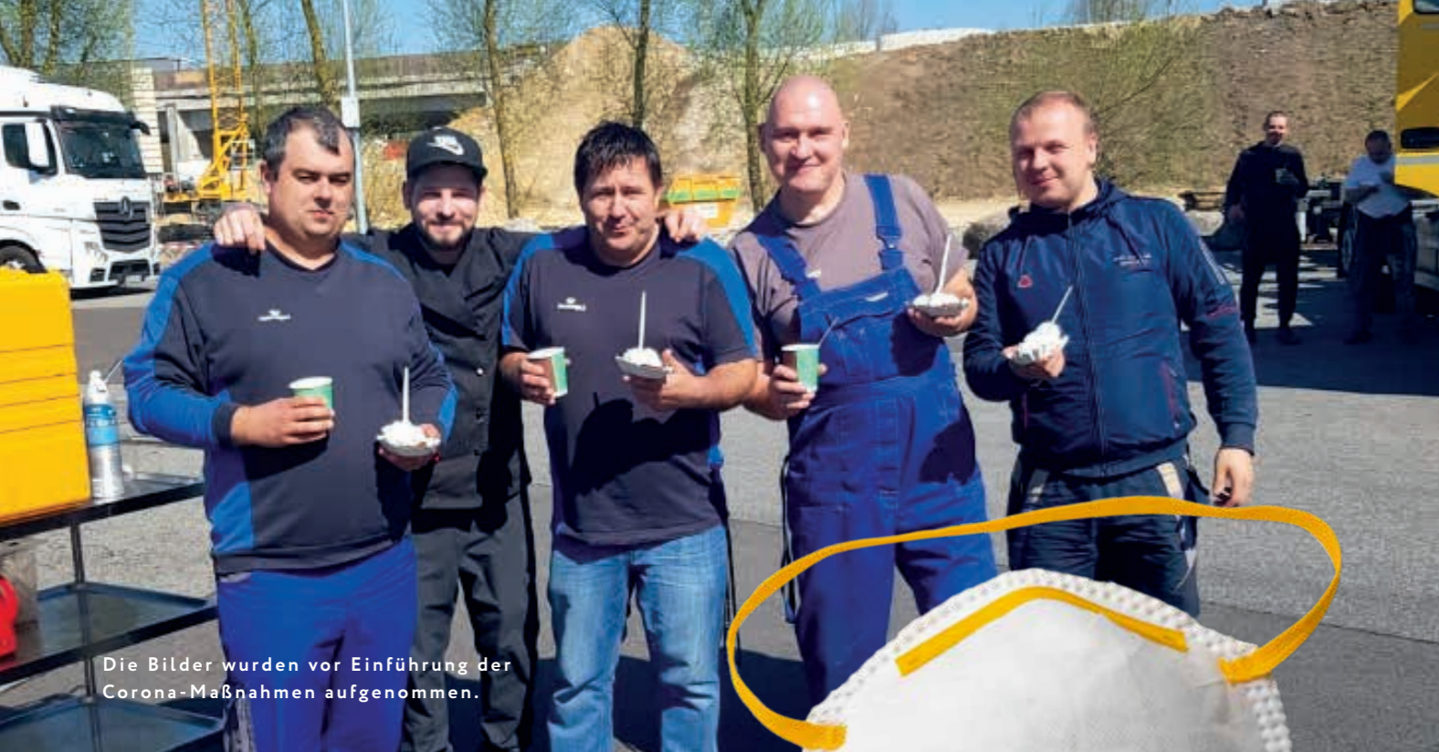
Die Bilder wurden vor Einführung der Corona-Maßnahmen aufgenommen.